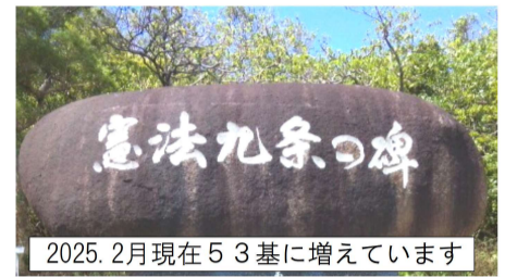
2025.2月現在53基に増えています

連日、イスラエル軍によるガザへの攻撃映像の凄惨さに目を覆いテレビのチャンネルを変えたくありません。が目を逸らすことが出来ません。元氣11月号で憲法九条の碑が全国に32基あり、私の住む小樽にもあることを知りました。九条を守り続けてきた我国だから戦争に手を染める事ができないと世界中に胸を張って言えるのではないのでしょうか。今、新婦人の仲間と脳活に励んでいます。柔らかくなった頭で戦争体験のこと、弱者を蔑ろにする政策のことなど、話題は尽きません。高齢の私達には大きな行動は望めませんが、この意志は必ず身近な人達に伝わるでしょう。国家間の紛争、戦争が一日も早く終結する日が来ますように願わずにはいられません！